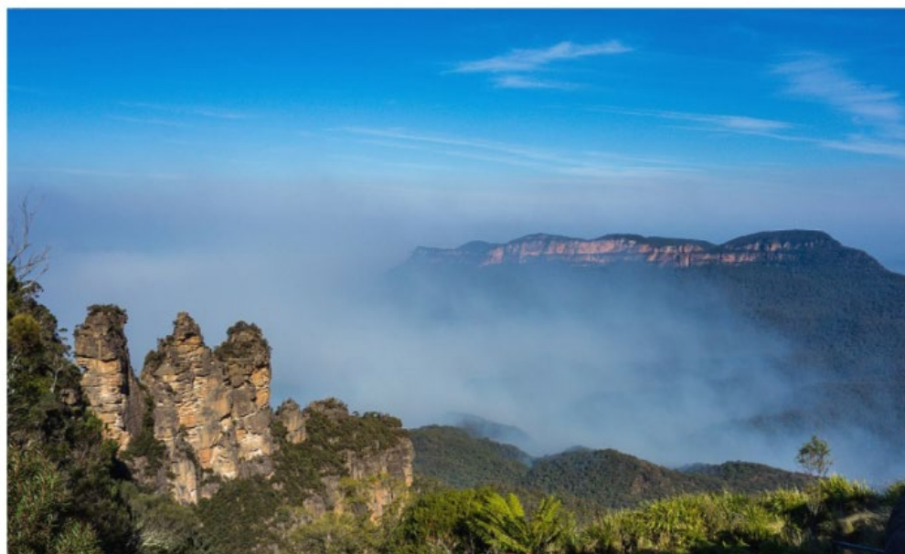
Three Sisters Mountain, Australia